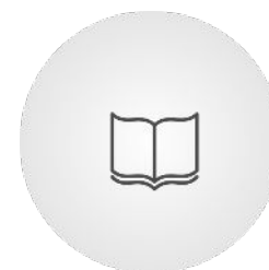
Escuelas globales de secundaria*